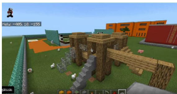
Kockavilág a játszótér háttérében az iskola