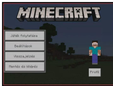
Gyémántépítő – a profi