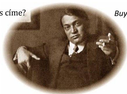
Buy Nataliya, 12. dny