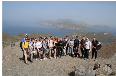
A Vulcano tetején a Lipari-szigeteken

16 évvel ezelőtt alakult meg az Ady Gimnázium túra szakköre, Vágtató Híppók néven. Tízen kezdtük, mára több százra tehető azok száma, akik részt vettek egy vagy több Vágtató Híppók túrán középiskolai tanulmányaik során. Vannak tagjaink, akik nem hagynának ki egy túrát sem, vannak olyanok, akik már valamelyik egyetem padját koptatják, de még visszajárnak. Hogy miért?